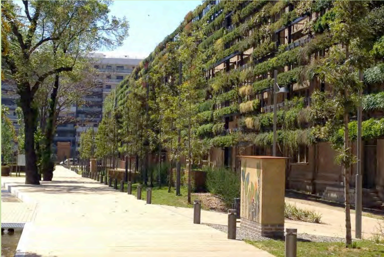
Edificio Tabacalera. Tarragona