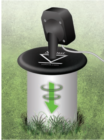
Abertura del Pozo