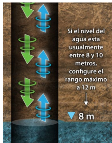
Profundidad de Agua