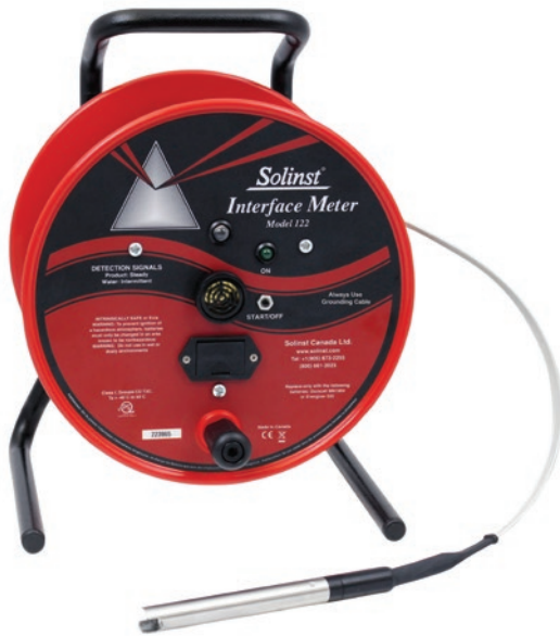
Sonda de Interfase Aceite/Agua