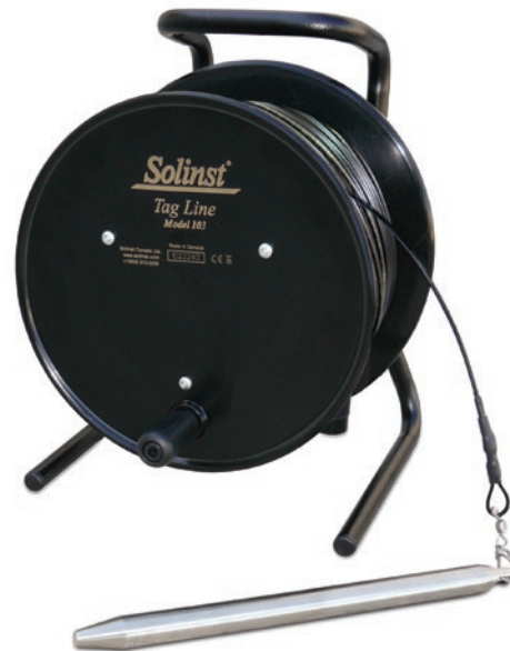
Tag Line/ Cable de suspensión