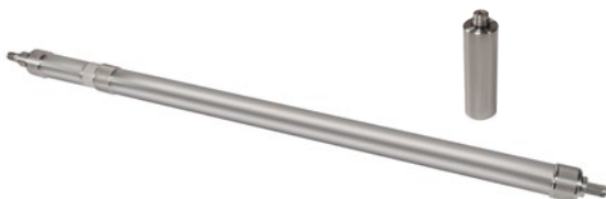
Muestreador de intervalo discreto de muestreo profundo 425-D y peso

® Marca registrada de Solinst Canada Ltd.