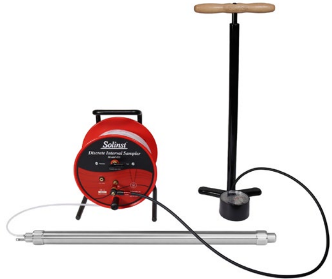
Muestreador Discreto de Intervalos de 1.66" (42mm) con bomba manual de alta presión.

Solinst también tiene disponibles bailers Biodegradables desechables en PVC y bailers en acero inoxidable Bailer Puntual (ver Modelos 428 BioBailer & 429 Bailer de Fuente Puntual).