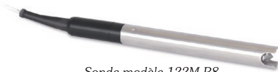
Sonde modèle 122M P8

La sonde d'interface 122M utilise une sonde P8, en acier inoxydable, de 16 mm (5/8 po) de diamètre. Elle est résistante à la pression jusqu'à 500 psi. Le faisceau est émis à partir d'une pointe Hydrex en forme de cône. La pointe est protégée par un bouclier en acier inoxydable intégrée et elle est excellente pour la grande majorité des situations de surveillance d'hydrocarbures. Une brosse de nettoyage est fournie avec chaque mini-sonde.