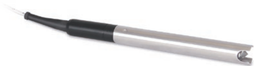
Sonda P8 del modelo 122M

El 122M usa la sonda P8, tiene un diámetro de 16 mm (5/8") y es de acero inoxidable. Resiste presión hasta 500 psi. El haz se emite desde una punta con forma de cono Hydrex. La punta está protegida por un blindaje de acero inoxidable integral y es excelente para la gran mayoría de situaciones de monitoreo de producto. Un cepillo para limpiar esta incluido con cada sonda.