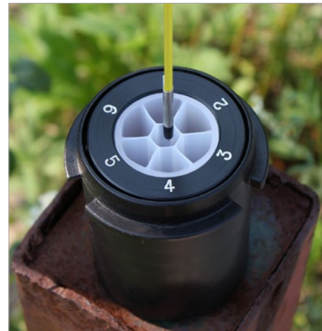
Mediciones hechas a través de los canales angostos del sistema Multicanal CMT de Solinst.

El medidor Mini se ofrece en longitud única de 25 m o 80 pies Se puede suministrar con las sondas P4 o P10.