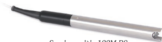
Sonde modèle 122M P8

La sonde d'interface 122M utilise une sonde P8, en acier inoxydable, de 16 mm (5/8 po) de diamètre. Elle est résistante à la pression jusqu'à 500 psi. Le faisceau est émis à partir d'une pointe Hydrex en forme de cône. La pointe est protégée par un bouclier en acier inoxydable intégrée et elle est excellente pour la grande majorité des situations de surveillance d'hydrocarbures. Une brosse de nettoyage est fournie avec chaque mini-sonde.